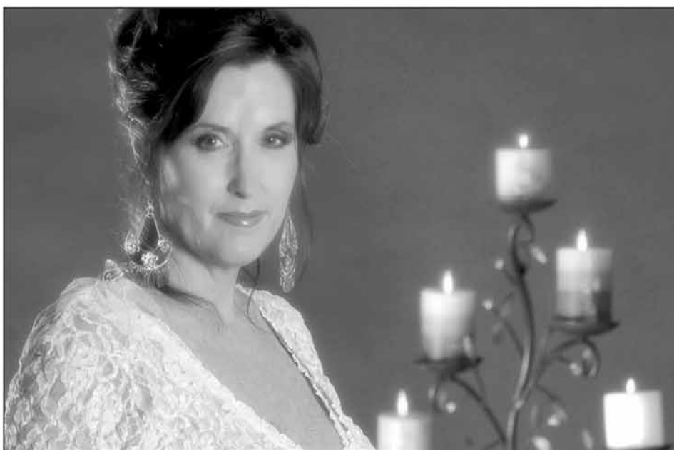
La cantante de descendencia mexicana Juanita Ulloa

MIAMI (EFE).- Para los amantes de la ópera y el mariachi, la cantante Juanita Ulloa ofrece una propuesta musical única: "Operachi", una fusión de géneros que une los elementos clásicos de la ópera con el sentimiento de la música tradicional mexicana.